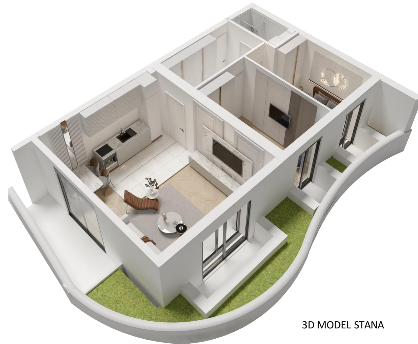
3D MODEL STANA